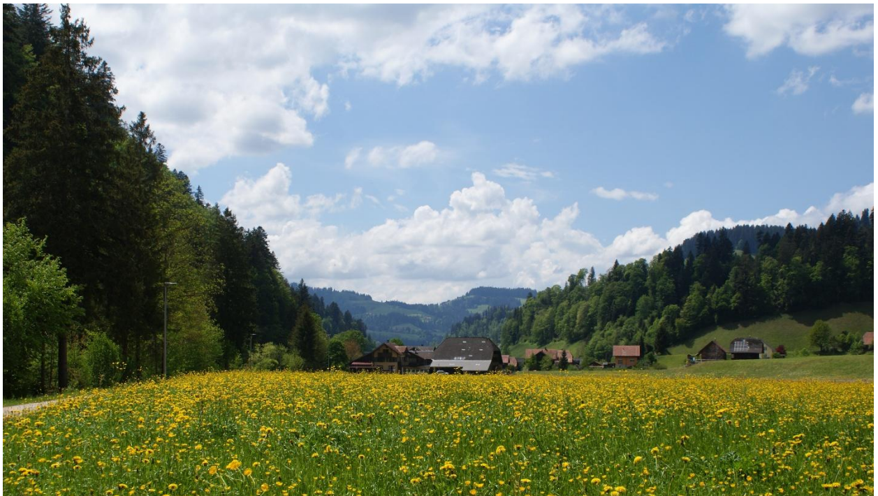
Blick vom Unterfeld in Richtung Längengrund; Isabelle Bähler